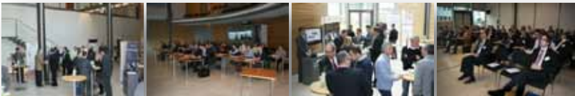
Bilder des RemoteServiceForum vom 22.-24. Februar 2011 Remote Technology, Remote Security, Remote Services

Neue Technologien und Businessmodelle mit strukturierten Sicherheitskonzepten kombinieren – die Branchen beginnen, voneinander zu lernen.